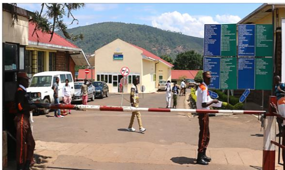
Coopération de l'HEGP avec le CHU de Kigali sur le thème de la gériatrie (Rwanda)