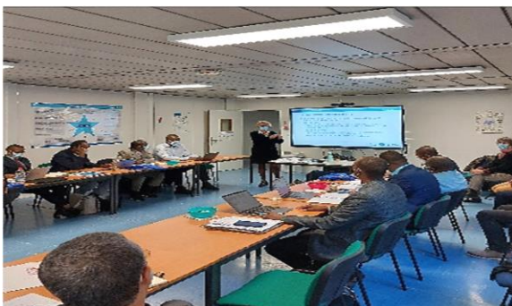
Séminaire de formation au management à la DRI