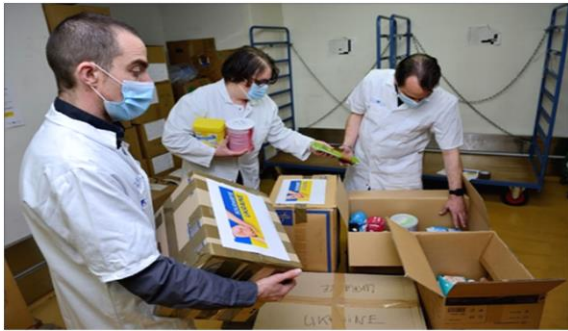
Aide à l'Ukraine mars 2022