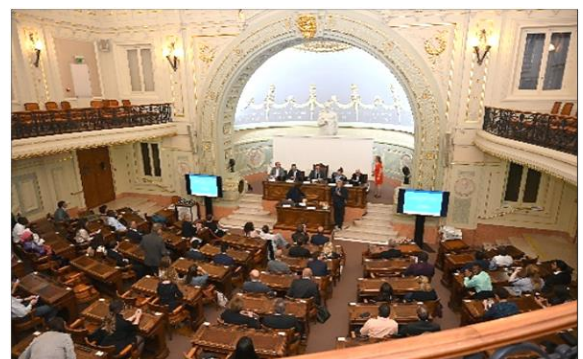
Cérémonie en l'honneur des médecins étrangers REHP à l'Académie de Médecine