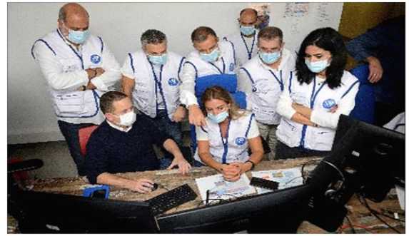
Formation au CFARM des médecins libanais pour la mise en place d'un SAMU à Beyrouth