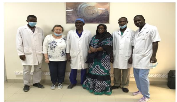
Formation des « majors » à Nouakchott, Mauritanie