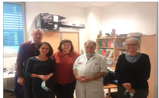
Visite d'une délégation de Moldavie