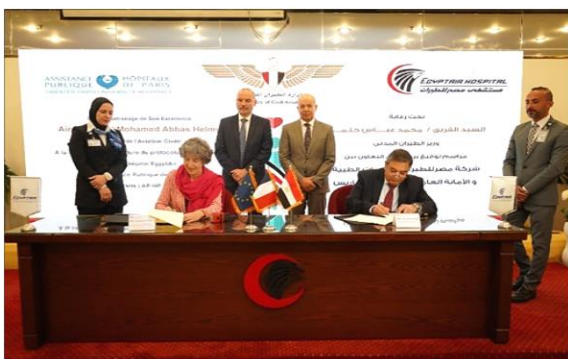
Signature d'un accord de coopération avec l'hôpital d'Egyptair au Caire