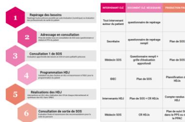
Vue synthétique du parcours patient général

Information par tout créneau de communication de la communauté médicale et paramédicale Référencement du patient auprès de l'unité des soins de support Consultation auprès de l'IDE de coordination et consultation médicale Recueil des échelles : "distress thermometer", questionnaire INCa et QLQ-C30 Etablissement du parcours auprès des PS Présentation des associations Explication des relais vers la ville (Réseau Oncodiet, réseau RKS, Maisons sport – santé...)