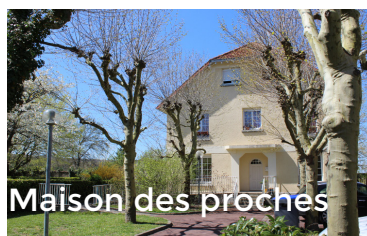
Maison des proches